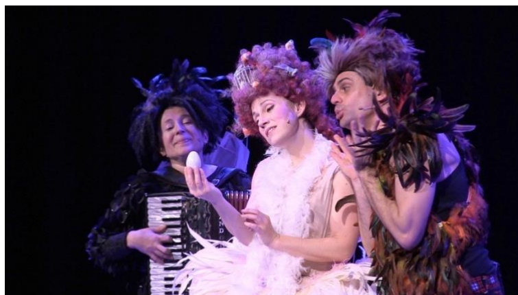
La compagnia Trioche sarà oggi sul palco dell'Auditorium di Morciano

Con 'PapagHeno PapagHena' la compagnia Trioche oggi all'Auditorium di Morciano. La regista: "Un sogno di libertà"