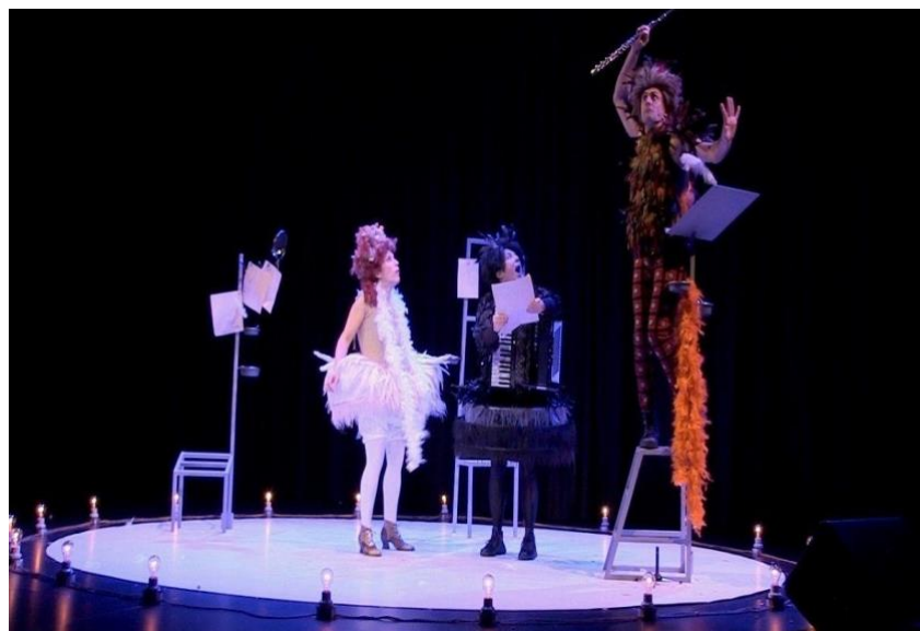
PapagHeno PapagHena PEM

https://www.mentinfuga.com/papagheno-papaghena-i-pappagalli-di-mozart/