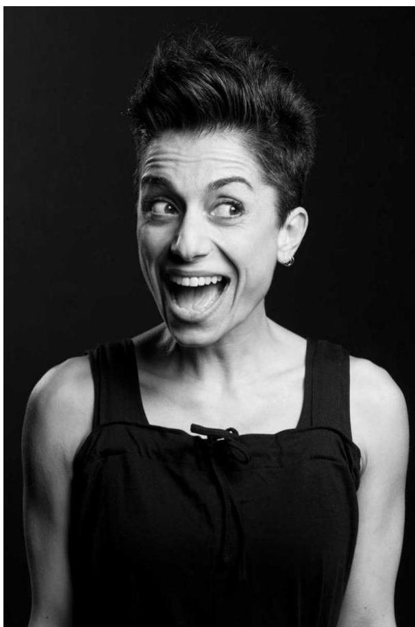
UNA MARCIA IN PIÙ

Liberarsi da etichette e stereotipi per creare un mondo che accetta tutti e non giudica nessuno . Questo il pensiero dell'attrice e regista comica, che dell'incisività fa la bandiera dei suoi spettacoli.